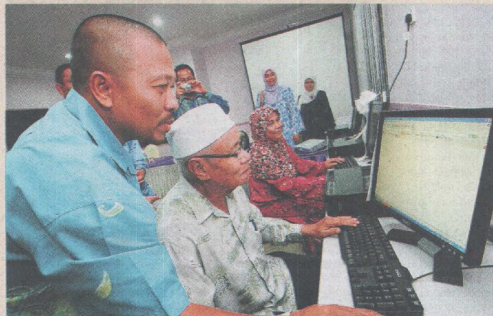
NEMO... rapatkan jurang digital.