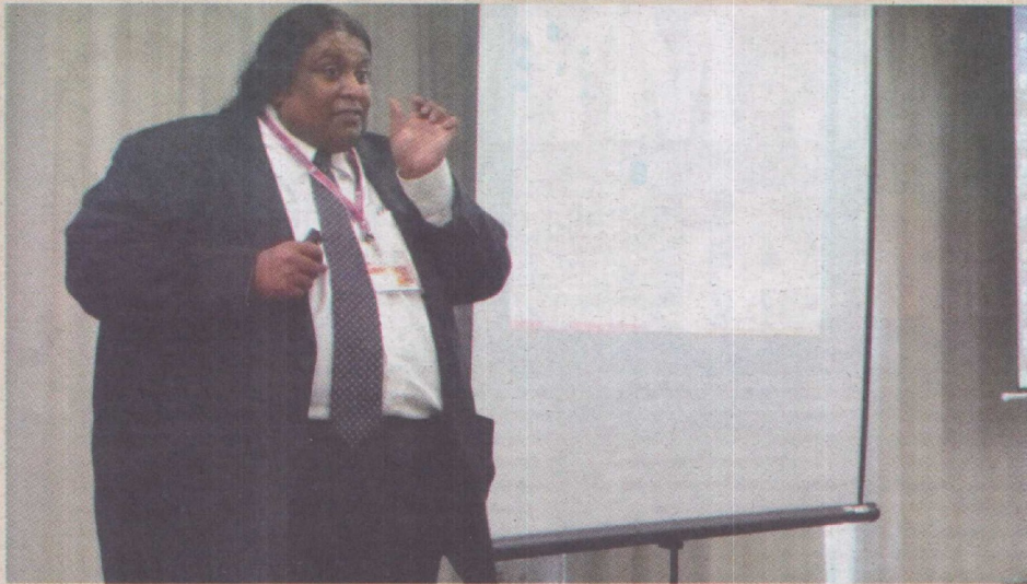
DR LUKOSE... Web 3.0 gabungkan pelbagai dat