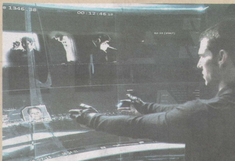
MAJU... Web 3.0 mampu hasilkan pelbagai aplikasi seperti dalam filem futuristik.

Inovasi itu memberikan kelebihan dalam capaian Internet dan mampu mengurangkan jurang digital di luar bandar dengan menggunakan platform WiWi