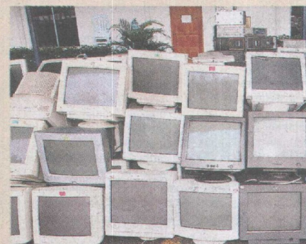
SASARAN... apa gunanya komputer tanpa sambungan WiWi.